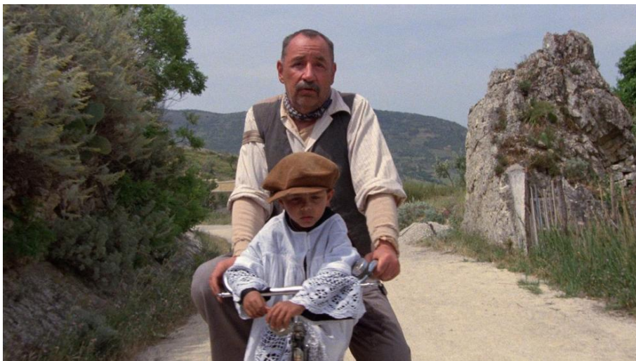
Salvatore Cascio y Philippe Noiret en 'Cinema Paradiso'

En su momento ganó el Oscar y el Globo de Oro a la mejor película de habla no inglesa , también cinco premios BAFTA, cinco premios David Donatello, el Gran premio Especial del Jurado de Cannes (exaequo con Demasiado bella para ti de Bertrand Blier) y un montón de galardones más . Y transcurridas más de tres décadas desde su estreno, en 1988, sigue manteniendo su estatus de ser una de las películas más queridas por los amantes del cine. Giuseppe Tornatore firmó una carta de amor al séptimo arte con Cinema Paradiso , tan maravillosa como irreplicable.